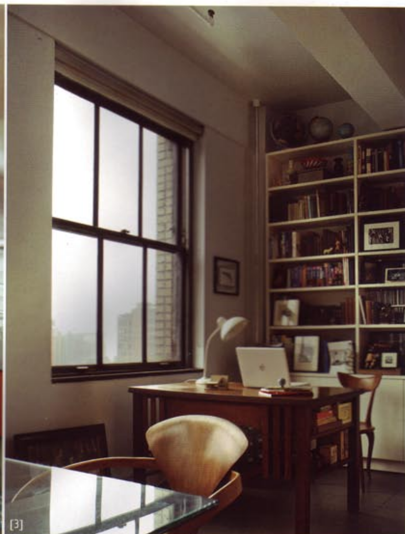
3. חדר העבודה משמש כמעבר בין אזור האירוח לחדר השינה. 4. "בלגן מאורגן" מאפיין את הקו המאוד אישי של בעל הבית שהוא גם האדריכל. 5. למרות חסרונם של אלמנטים טקסטילים יש תחושה של חמימות הנובעת משילובי פריטים, כאילו במקרה, ואוספים של פריטים אותם ליקט הבעלים בעולם.